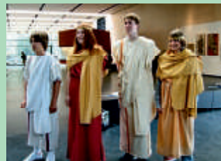
Projekttag in Carnuntum