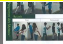
V4 - Programm des Monats

GYMNASIUM unter besonderer Berücksichtigung sprachlicher Kompetenz