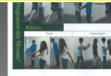
V4 - Programm des Monats

GYMNASIUM unter besonderer Berücksichtigung sprachlicher Kompetenz